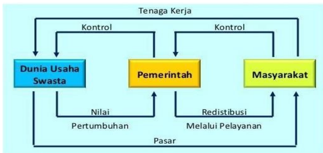
Bagan 2. Hubungan pemerintah, swasta, dan masyarakat dalam mekanisme perekonomian

lembaga-lembaga terkait baik lembaga yang ada dalam pemerintahan maupun di luar pemerintahan (Rachbini 2002). Artinya, sejalan dengan posisi teori regulasi ekonomi ini jika posisi pemerintah jelas disini merupakan pemegang kuasa paling kuat secara politik maupun ekonomi dibanding swasta dan masyarakat. Keseimbangan mekanisme bisa dicapai dengan interaksi ketiga pihak yaitu swasta/perusahaan, pemerintah dan masyarakat yang saling mendukung. Dalam perekonomian pemerintah merupakan pelaku ekonomi dengan tujuan dan perannya sendiri, namun peran negara sebagai pelaku ekonomi berbeda dengan swasta karena disamping tujuannya mencari laba pemerintah juga mengemban tanggung jawab untuk mensejahterakan masyarakatnya serta menjaga keseimbangan ekonomi dalam interaksinya dengan swasta dan masyarakat. Berikut bagan yang dapat memperjelas peran dan posisi pemerintah dalam mekanisme perekonomian.