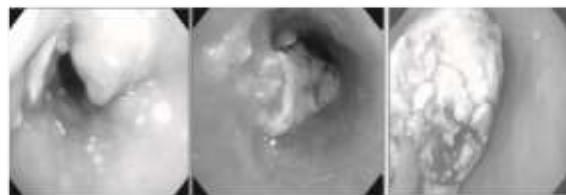
Gambar 3. Karsinoma esofagus tampak dari endoskopi. 10