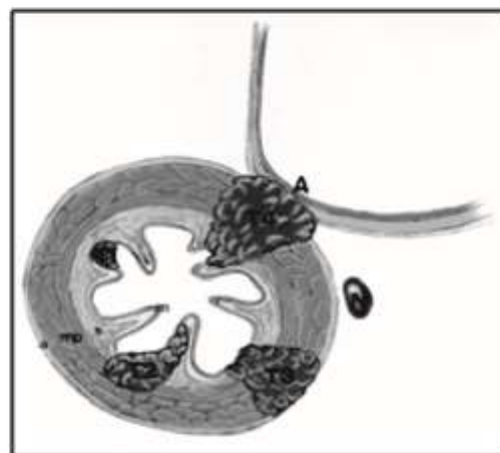
Gambar 4. Ilustrasi pembagian stadium T pada karsinoma esofagus. 10

Stadium T hanya menilai kedalaman penetrasi tumor pada esofagus bukan menilai panjang dari tumor atau penyempitan dari lumen esofagus. Pada Tx tumor tidak dapat dinilai, T0 tidak terbukti adanya tumor primer, sedangkan pada Tis merupakan carcinoma in situ. T1 tumor menginvasi lamina propria, muscularis mucosa submukosa tapi tidak sampai menembus ke submukosa. Pada T2 tumor menginvasi ke muscularis propria tetapi tidak sampai menembus muscularis propria. Pada T3 tumor menginvasi jaringan periesofageal tetapi tidak menginvasi struktur lain yang berdekatan. Pada T4 tumor telah menginvasi struktur lain yang berdekatan dengan esofagus (gambar 4). 2,3,10,13,15